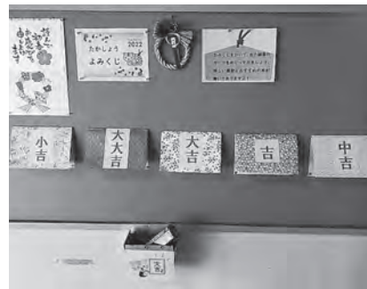
新年にはよみくじで運試し