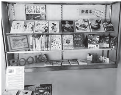
展示資料を手にとれるようになりました