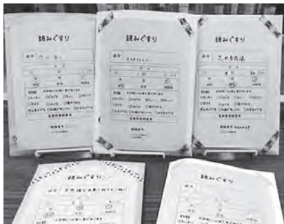
よみぐすり処方しました