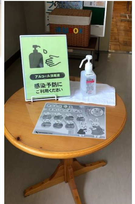
入口 消毒用アルコール